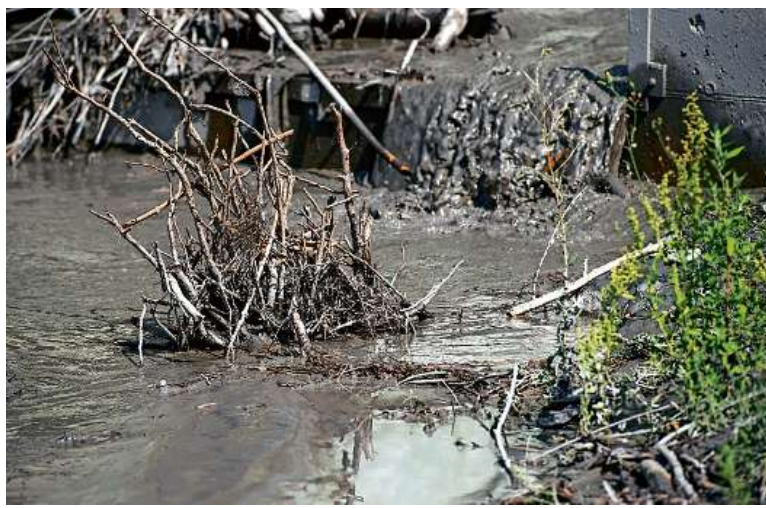
Am Tag danach: Die Dorfrüfi in Trimmis zeugt von den Unwettern, die am 1. August niedergegangen sind.