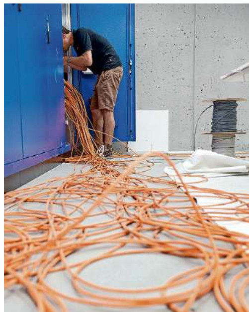
Einblick ins beeindruckende Innenleben des neuen Unterwerks Quader: Bis zur Inbetriebnahme der neuen Schaltanlagen (Mitte) müssen noch kilometerweise neue Leitungen verlegt und Kabel eingezogen werden. Die Hoch- und Mittelspannungsleitungen (links) werden in einem doppelten Boden verlegt.