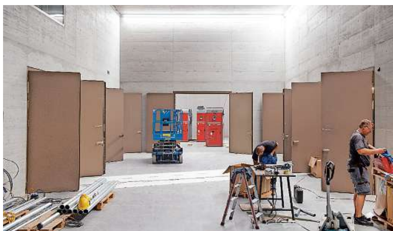
Tag der offenen Türen: Blick in den sieben Meter hohen Manipulationsraum in der Mitte des neuen Unterwerks Quader.

Die beiden wortwörtlich gewichtigsten Bauteile fehlen derzeit noch, nämlich die beiden je 40 Tonnen schweren Transformatoren, die die elektrische Spannung von der Hochspannungsebene auf die Mittelspannungsebene umwandeln. Diese werden am 21. und 22. August angeliefert und über einen Einbringschacht ins Gebäude heruntergelassen werden diese dort an ihren definitiven Standort verschoben. Bereits Mitte August geht die Mittelspannungsanlage in Betrieb. Bis Ende September sollten gemäss Projektleiter Giovanoli auch die ausgiebigen Tests abgeschlossen sein, so dass die gesamte Anlage, die vollautomatisch betrieben wird, ihrer Bestimmung übergeben werden kann. Vom beeindruckenden Innenleben des Bauwerks wird dann oberirdisch nichts mehr zu sehen sein.