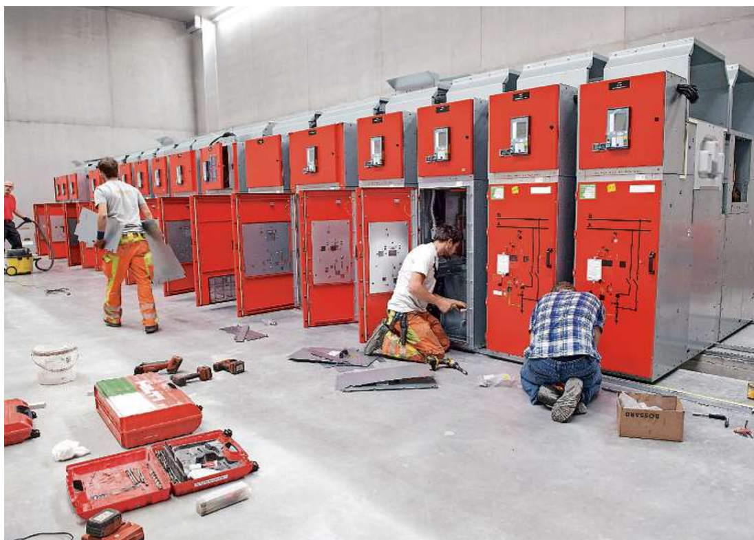
Im neuen Unterwerk Quader der IBC in Chur wird auf Hochtouren am Innenausbau gearbeitet: Im Bild der Einbau der Mittelspannung Schaltanlage für die lokale Stromversorgung.